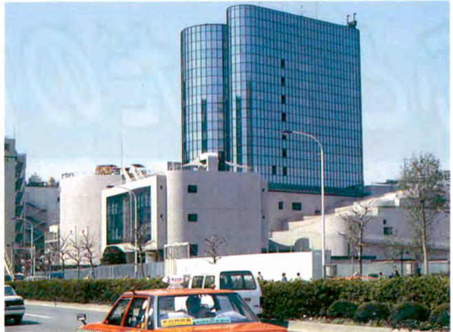
青山通りから撮影

この眺め 一度だけ 「こどもの城」の東側に建て、古い高層ビルが立ち並ぶ一帯が、今や大冒険の舞台となつてきました。