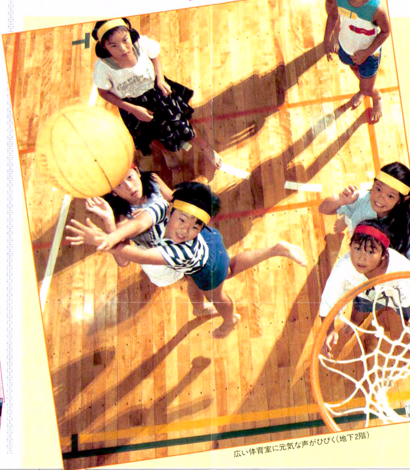
広い体育室に元気な声がひびく(地下2階)

「こどもの城」地下2階に、25メートル・5コースのプールと体育室、各種のプレイと体育室、各種の類似施設に比べて、場所の体力や運動能力がチェックできる健康開発室、トレーニングマシン(大人用)など優れた設備が整えられています。 「こどもの城」という名前を集めているのは、あま、学的な体力測定を特色の「大人のためのD・H・C」です。結果に基づいた「運動」の処方により、自分に適したプログラムに参加します。また、トレーニング・シ