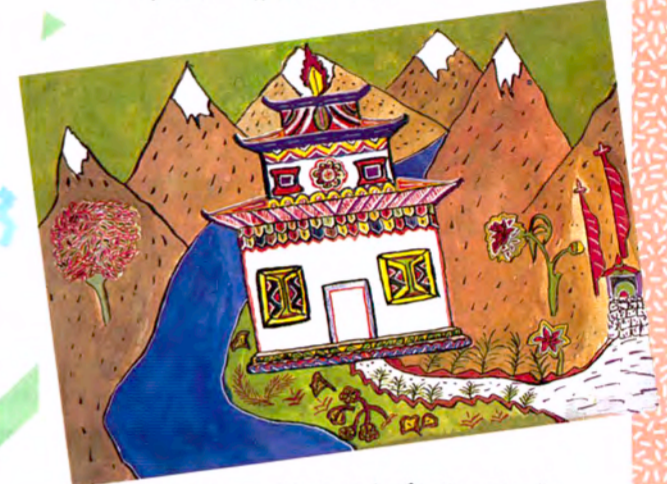
ヤエシエイ・レンドブ(ブータン)