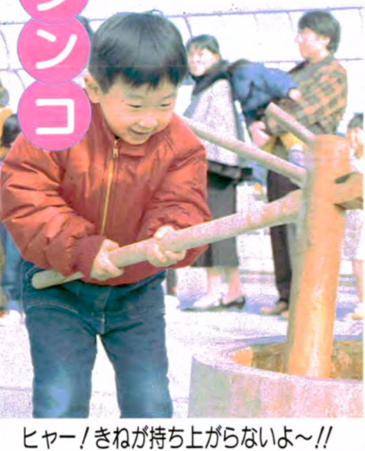
ヒヤー! きねが持ち上がらないよ~!!