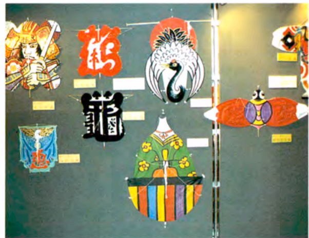
いろいろなタコたち

世界のタコを集めた「おもしろいタコ大集合」が、冬休みに「こどもの城」一階のキヤラリーで開かれ人気を呼びました。 風の博物館と日本風の会の協力で、各地の変わったタコ、おもしろいタコ約百三十点を展示したもので、目玉は、高さ六メートルある「江言双豚」(写真上)、実際に揚げられる「タコ」(写真下)、勇壮な「津軽風」などが見どころでした。