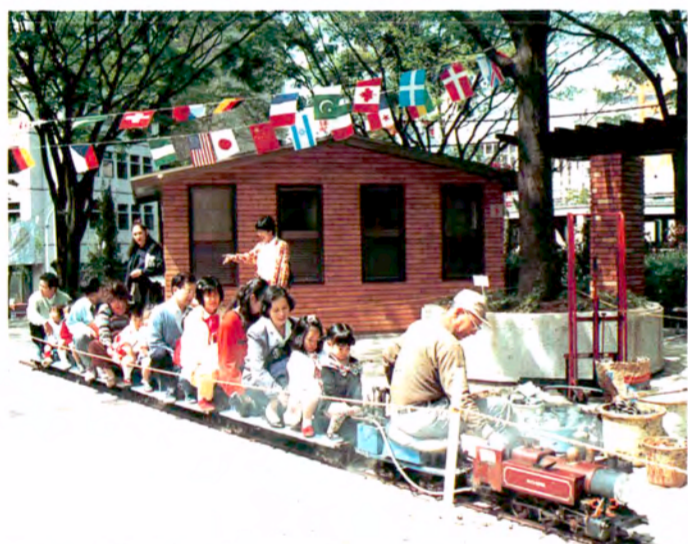
〈東京都児童会館で〉人気を集めた豆列車。本物そっくりにシュッポッポ