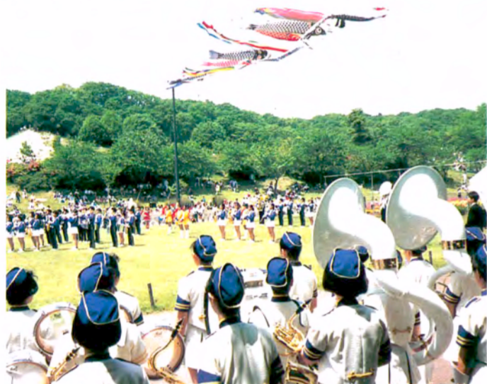
〈こどもの国で〉こいのぼりがおどる自由広場で楽しい吹奏楽の演奏