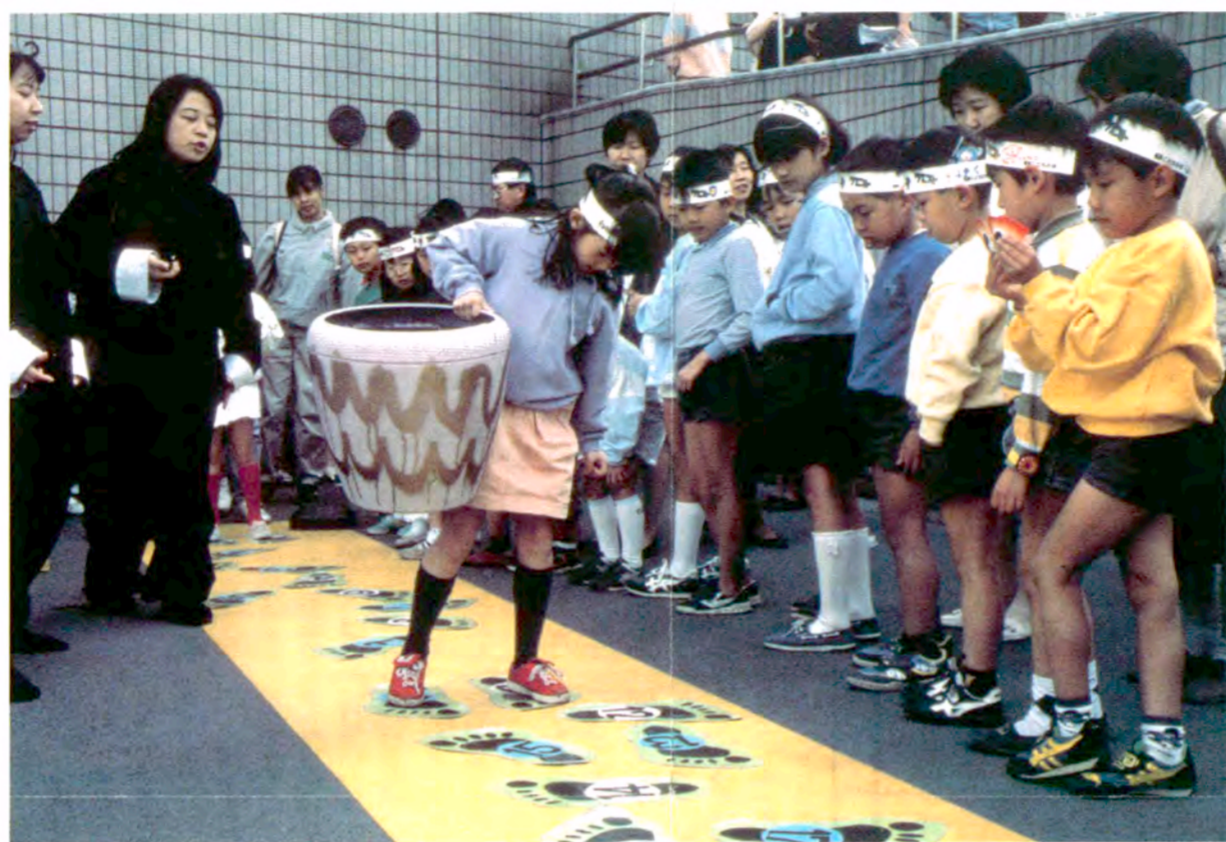
〈こどもの城で〉「キャッスル・クエスト」の関門のひとつ「酔拳」。大きなカメラを持って足型をたどる