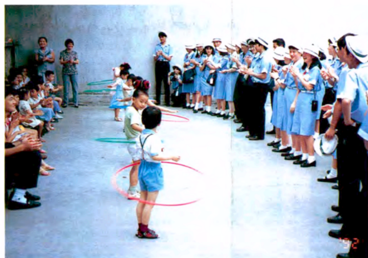
幼稚園児がフラフープで歓迎 (上海近郊の農村で)