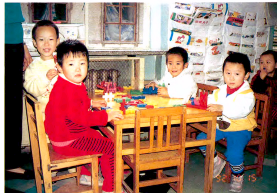
かわいい笑顔がお出迎え (北京市内の幼稚園)