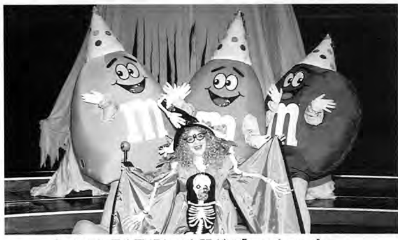
キャンディ君も登場して大騒ぎの「ハロウィンパワー」