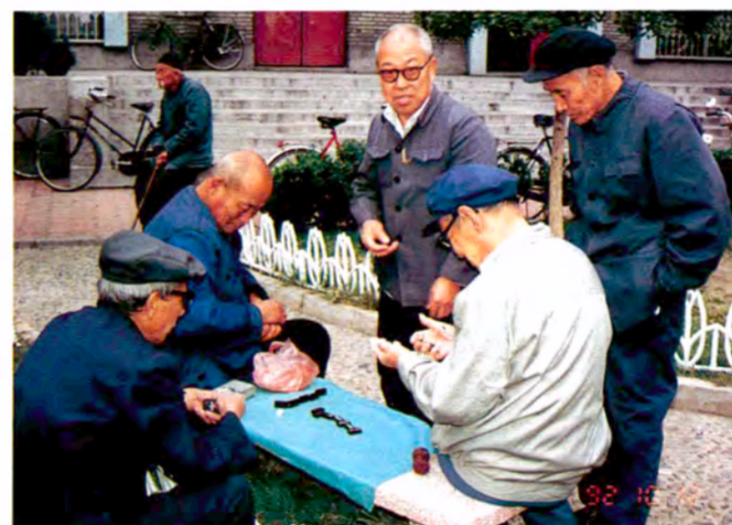
道端でのんびりドミノを楽しむお年寄りたち (天津市内)