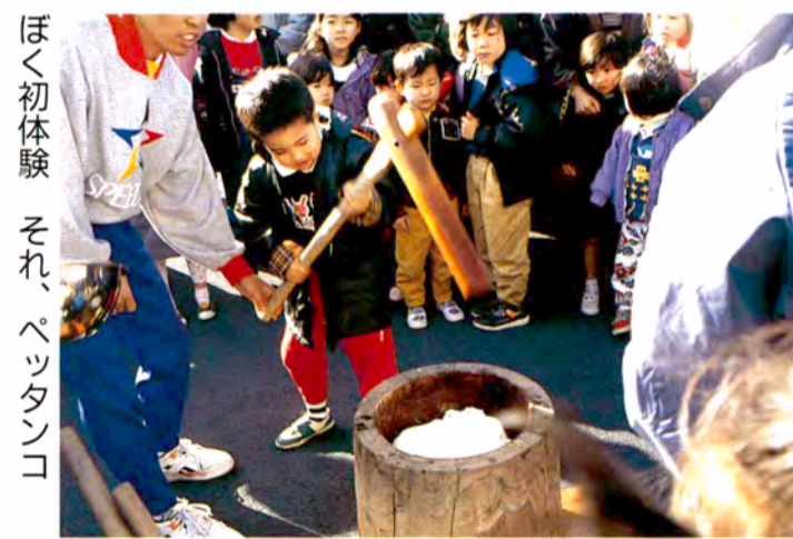
ほく初体験 それ、ベタンコ

所在地 〒150 東京都渋谷区神宮前5-53-1 電話 03-3797-5666 開館時間 平日 午後12時30分～午後3時30分(入館は3時まで) (学校の季節休み、土・日・祝祭日は 午前10時から開館いたします。) 休館日 月曜日(月曜日が祝祭日の場合は火曜 日、また学校の季節休み中は変更にな ります) 入館料 3歳以上18歳未満/300円 おとな/400円 こどもの城ご案内 交通 渋谷駅(東急文化会館口)・地下鉄参道 駅(B2出口)からそれぞれ徒歩7-10分。 レストラン、軽食、喫茶店、ホテル、研修(会議)室、売店、 ギャラリー、駐車場(70台収容)併設 青山劇場・青山山形劇場/電話 03-3797-5678