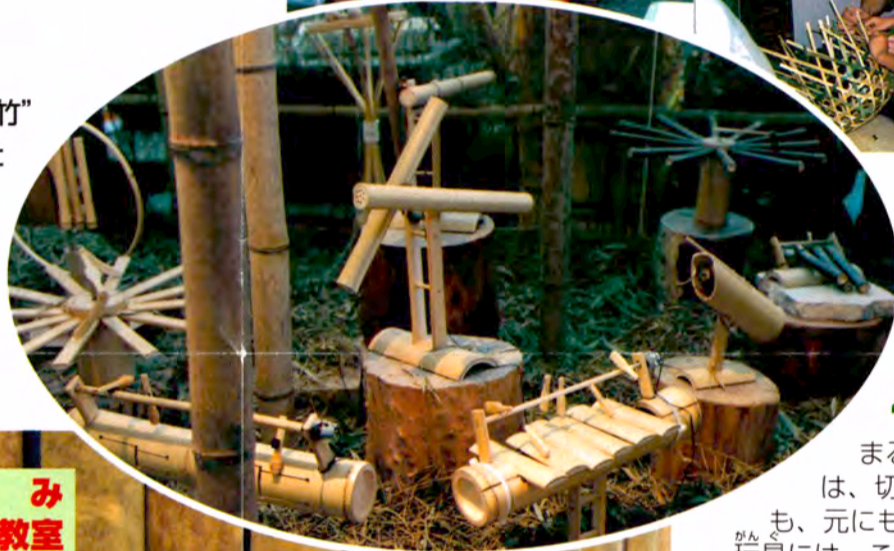
◀松本秋則さん(造形作家)の作品