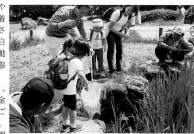
「ザリガニが釣れたぞ」。みんなの目が「しかけ」の先に集まります。

(葛飾区)。 ■定員■ 15家族。 ■参加費■ 一人1,000円(保険料・プログラム費など) ※集合場所までの交通費は各自で負担。 ■受け付け■ 4月21日正午から電話で先着順に受け付け(1回線につき1家族)。 お問い合わせ・お申し込みは、体育事業部(担当=大関)【03-3797-5660】へ。