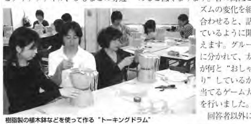
樹脂製の植木鉢などを使って作る“トーキングドラム”

平成17年度第1回こどもの城児童厚生員等実技指導講習会が5月18・19日に開かれました。