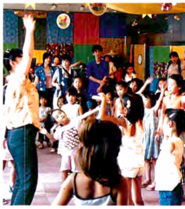
※写真はいずれもイメージです。

ドルッチャ広場では、1日2回(1時30分と3時30分)みんなで楽しむ「ドルッチャフェスティバル」。オリジナルのヒップホップ系のダンスも登場。カーニバルのように、みんなの熱気で暑さをふきとばします。