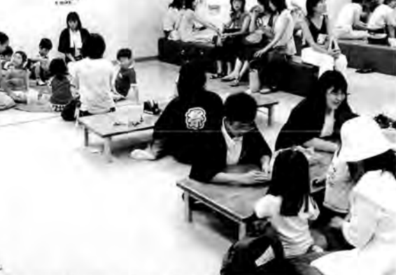
6人の中学生は、折り紙で子どもたちを遊ぶプログラムを体験しました。

「わっしょい 折り紙つりばり」。折り方に関心を深め、みずからの進路をひらいていく姿勢や資質を養う機会になればと、東京都の事業計画に基づいて行われているもの。6人は、商店、保育所などさまざまな分野の職場のなかから、子どもたちとふれあう職場【こどもの城】を選びました。プレイホールのプログラムは、折り紙で金魚を作って、それを釣って遊ぶ