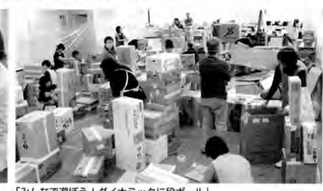
「みんなで遊ぼう! ダイナミックに段ボール」

健所など子育て支援プログラムを実施している施設の職員および関係者などが対象。定員は80人、受講料13,000円。先着順で受け付け中。