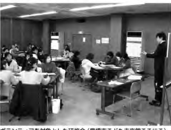
ボランティアを対象とした研修会(豊橋市こども未来館ここに)。

市(愛知県)「こども未来館ここに」のみなさんと、開館準備の段階で、研修会の開催や職員研修の受け入れなどをおして情報交換、開館のお手伝いをしました。