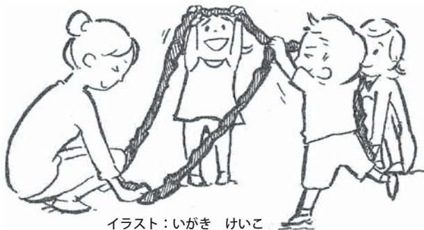
イラスト：いがき けいこ

家族ごとで遊んだオリジナルソング『WA!』に合わせて、“ゴムの輪”を持ったまま動きます。簡単な動きから始めて、みんなで遊ぶことに慣れていきます。