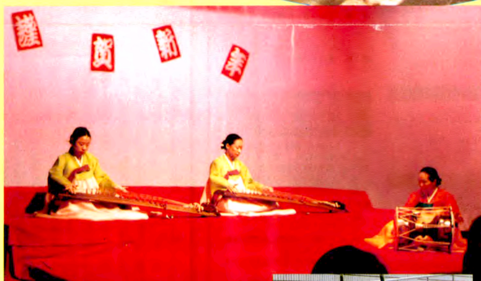
哀愁を帯びた韓国の琴(こと)の調べが音楽スタジオに流れる。ひき手の着た「チヨゴリ」の色があざやかだ(1/4)