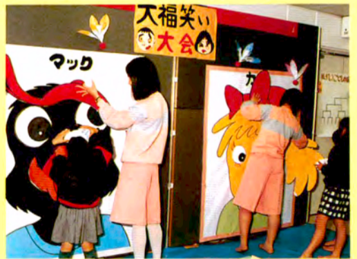
プレイホールではジャンボな福笑い大会が。目かくしを外しチャズルイぞ(1/3)