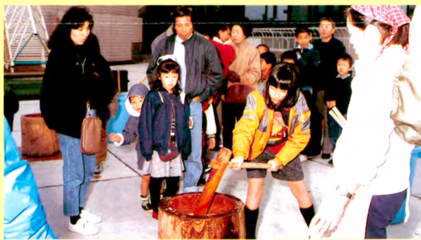
おもつきなんて初めてよ。サア、がんばらなくっちゃ(1/5)