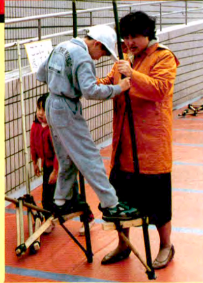
おととと—アンヨは上手(1/4)