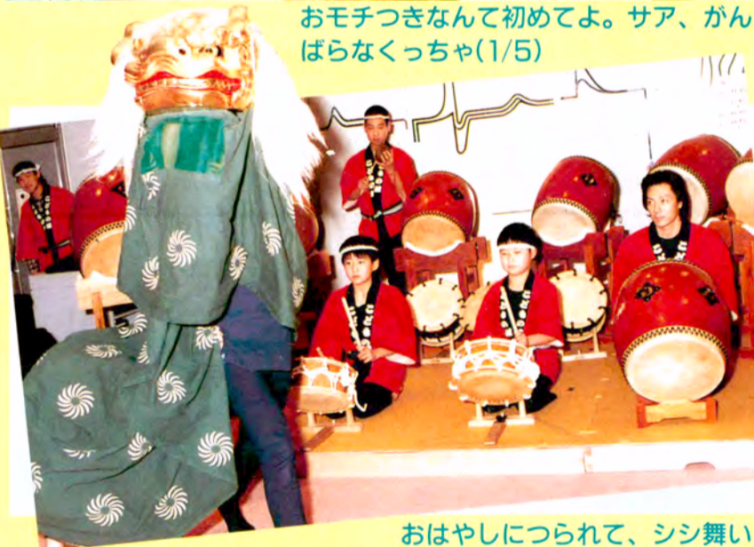
おはやしにつられて、シシ舞いがやってきた。バクバク、今年も張り切っていこうぜ(1/5)