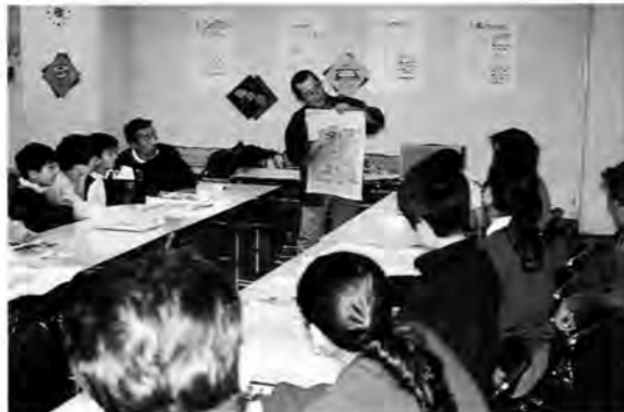
日本の凧の会の会員の指導のもとで、凧作りのワークショップ。角凧作りにも挑戦しました。