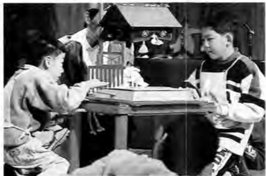
紙相撲初場所に大勢の力士が参加しました。

冬休み特別期間には、たくさんのお友だちが(こどもの城)に遊びに来てくれました。紙芝居や日光写真、玉すだれなど昔あそびのいろいろな催しが行われました。