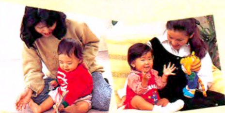
おやこ講座のマスコット「しまじろう」。お子さまを楽しい遊びの世界へ案内するガイド役です。

絵本やビデオ、玩具……遊び体験の中で、お子さまの考える力と感受性をすくすく伸ばします。