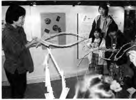
玉すだれに挑戦。太った魚、小さい魚—いろんな魚ができたけど、もとに戻すのがひと苦労。

駄菓子屋では、食べ物売りませんが、こまやめんこ、くじ付きのスーパーボールなどのおもちゃを販売しました。