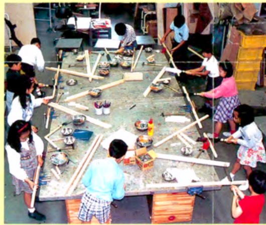
こどもクリエイティブクラブ

親と離れて、子ども(幼児)だけで参加するコースです。でも、友だちはいっぱいいるし、指導スタッフも子どもが興味を持って活動できるようにしているので、安心して参加できます。「幼児水泳」「幼児体育」「リズム・ムービング」など、初めての運動や音楽に親しむコースです。また、保育の多様なニーズに対応する「幼児グループ」や「保育クラブ」の保育プログラムもあります。