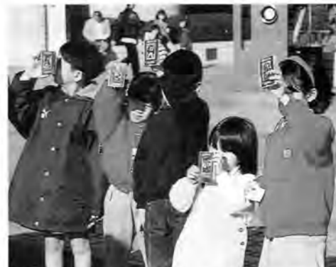
太陽の光を使って感光させる日光写真。種紙と印画紙を入れて、太陽光に当てて5分ほど待ちます。「まだかなあ〜」。