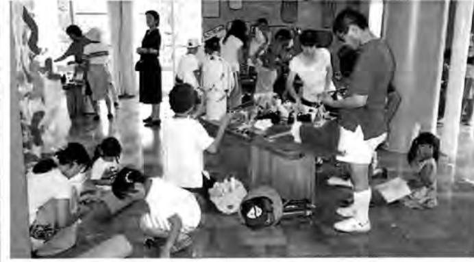
ユニークな外観の「愛知県児童総合センター」(写真左)と子どもたちでにぎわう「こどもアートカーニバル」の会場

のはっけんゾーン」「たいけんゾーン森のなか」「幼児コーナー」「ロボットシアター」が1階に。2階には「サウンドスタジオ」「クッキングスタジオ」「光のはっけんゾーン」「たいけんゾーンこどものまち」「えほんのへや」「大ホール」などがあります。開館記念の特別プログラムとして、7月24日から9月16日まで「ビ