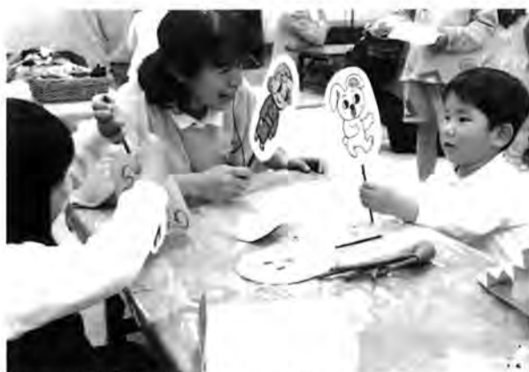
ボランティアとペープサートで「ごっこ遊び」

と同ペープサートで遊んだり、自分のペープサートを作ったりしました。また、紙コップを使った人形を作って、ボランティアと子ども、そして親と一緒に遊ぶなど、人と人の触れ合いを大切にしたい「手作り」の素朴な温かさにあふ