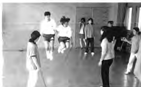
児童厚生員対象に「スポーツ遊び」の講習(静岡市の麻機児童館で)