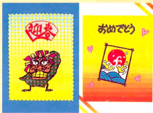
オリジナル・デザインのカラフルなカード

5歳以上の子どもたちを対象に、本物の争を演奏するプログラム。日本を代表する楽器の争ですが、実際に触れる機会は多くありません。【こどもの城】のスタッフが指導します。一緒に合奏しましょう。