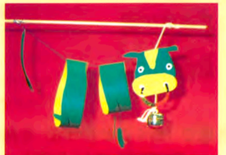
こども歳時記「お正月」(造形スタジオ)の作品

親の世代の「あそび」と、子どもの世代の「あそび」—形の上では大きく変わったように見えますが、「あそび」の心は同じです。親子で、友だち同士で、同じ「あそび」を楽しみながら、コミュニケーションを深めてもらえればと思います。