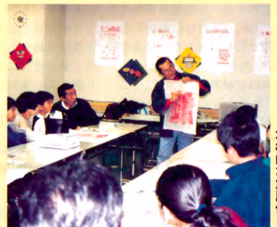
本格的な角風作り

パソコンでいろいろな絵を組み合わせて、カードをデザインします。画面の中で、みるみるカードが完成していくので、初めてパソコンに触れる子どもたちにも親しみやすいプログラム。カラー・プリンターで打ち出し、持って帰れます。