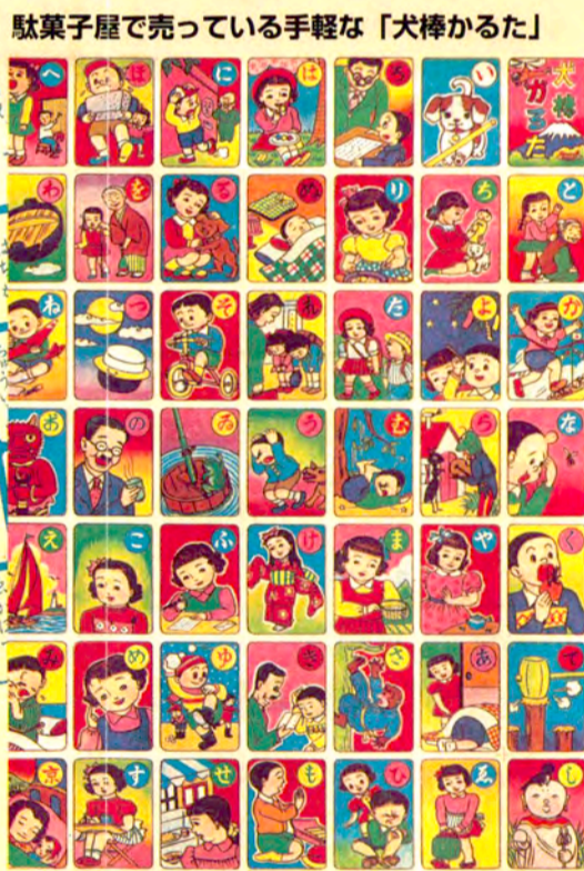
駄菓子屋で売っている手軽な「犬棒かるた」

【こどもの城】のボランティアのお姉さん、お兄さんと一緒にじっくりと時間をかけて、昔遊びに挑戦します。