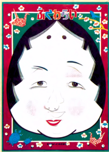
セイカノート(株)の作品

お父さん・お母さんが子どもだった昭和30年代の遊びを特集した、展示とワークショップです。親子で「あそび」を語り合い、一緒に楽しんでもらえればと企画されたものです。展示されるのは、当時の子どもたち(今の親たち)が遊んでいた「ふくわらい」「かるた」「すごろく」などです。昔のおもちゃの複製で遊ぶこともできます。会場入口にはなつかしい駄菓子屋も登場する予定です。