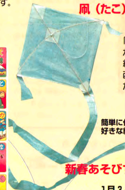
簡単に作れて、よく揚がる「えい凧」好きな絵を描くこともできます

「日本の凧の会」会員の指導を受けながら、角凧とえい凧作りをします。和紙と竹ひごを使って作った和凧は、西洋の凧(ゲイラカイトなど)と違った味わいがあります。