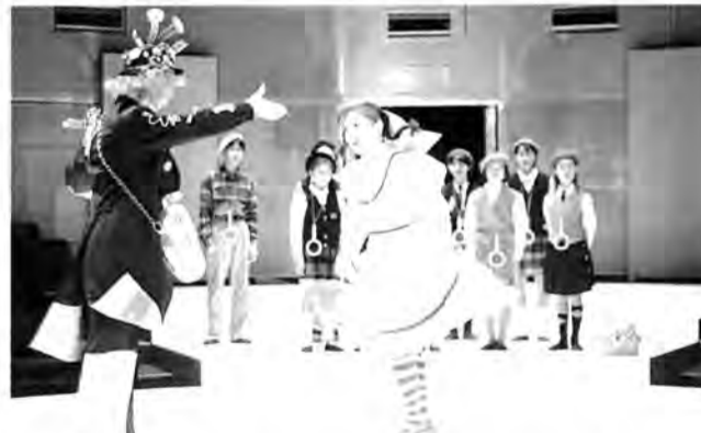
こどもの城・キリン・ファミリーオペレッタ(昨年の舞台から)