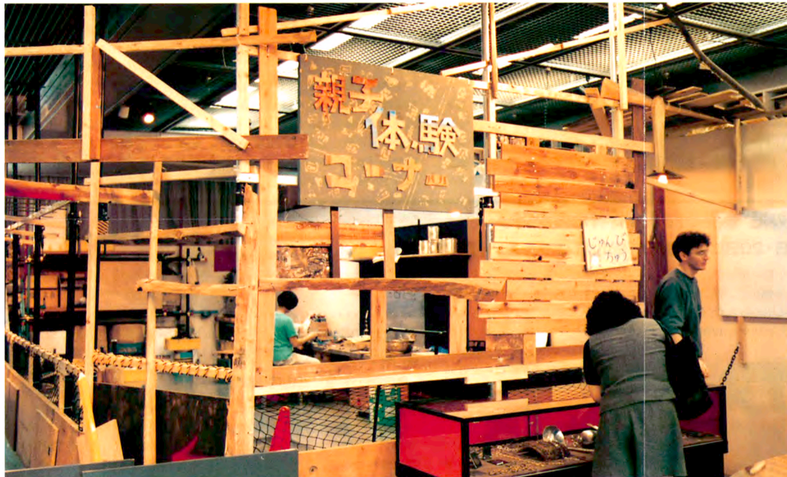
▲造形スタジオ内の「金属と造形～親子体験コーナー」は、7月23日にオープンします。