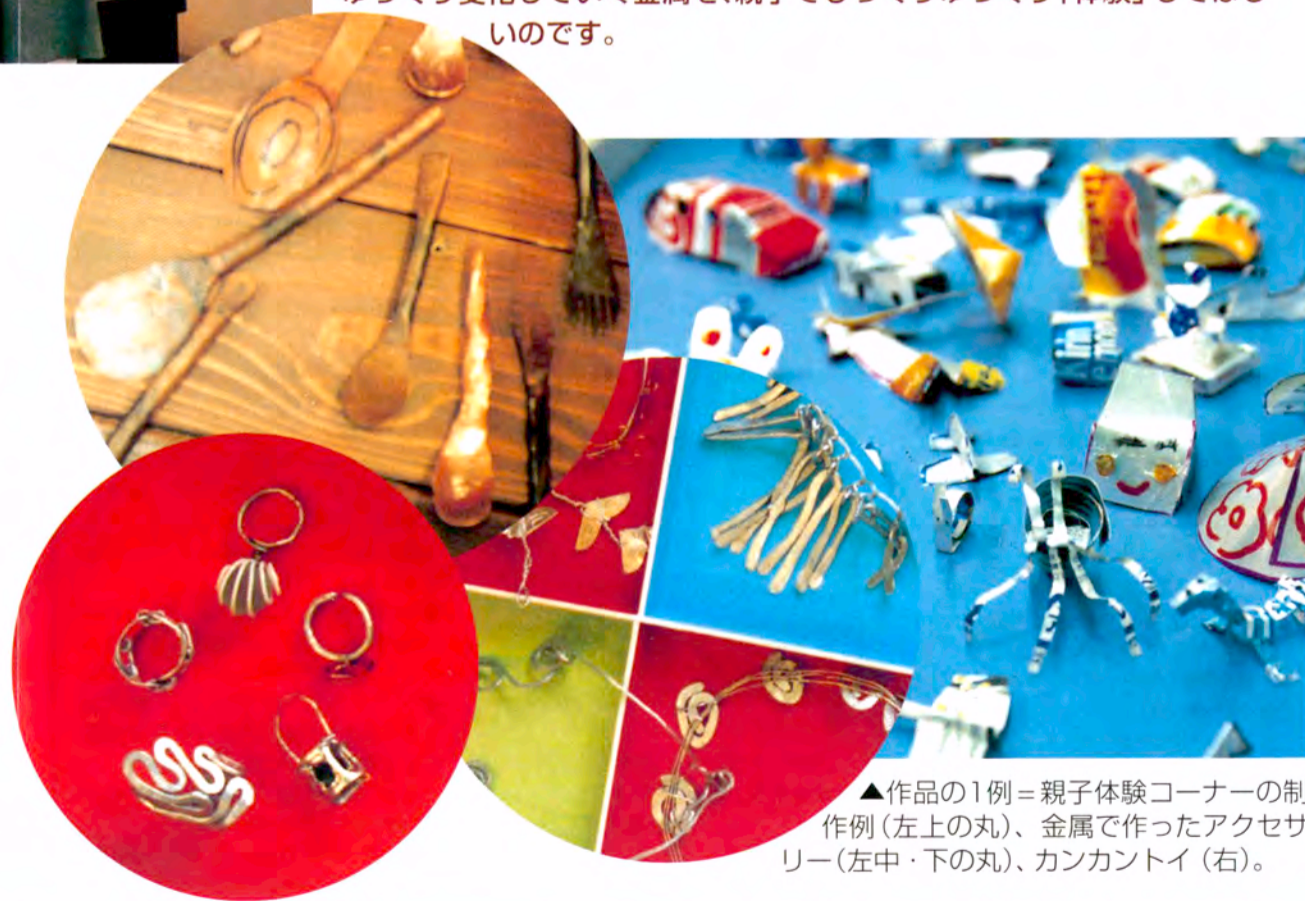
▲作品の1例＝親子体験コーナーの制作例(左上の丸)、金属で作ったアクセサリ(左中・下の丸)、カンカントイ(右)。

「親子コーナー」では、紙やセロハンテープなど子どもたちが使い慣れている素材と、細く切った缶などの「きんぞく」を組み合わせて制作します。小さな子どもでも造形活動を通して、知らず知らずのうちに「きんぞく」を体験できるプログラムを用意しています。「きんぞく」ってなあに!「これが、「きんぞく」なんだ」と気づく瞬間を大切にしたいプログラムです。