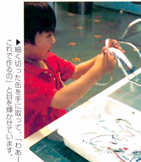
▶細く切った缶を手にとり、「わあ!これで作るの!」と目を輝かせています。