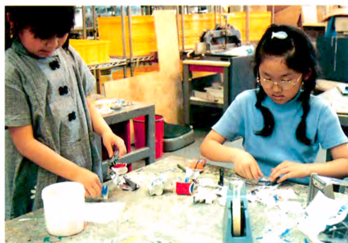
▲高学年の子どもたちは区切られた静かなコーナーでじっくり制作に取り組みます。

このコーナーでは作品を仕上げることが目的ではありません。じっくりゆっくり変化していく金属を、親子でじっくりゆっくり「体験」してほしいのです。