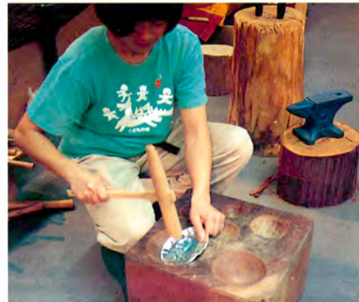
◀専用の道具を使って金属をたたいて形を整えているところ。