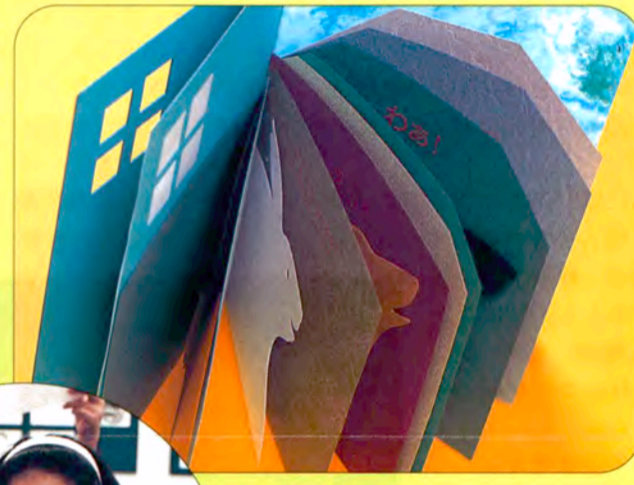
駒形克己「紙の絵本」