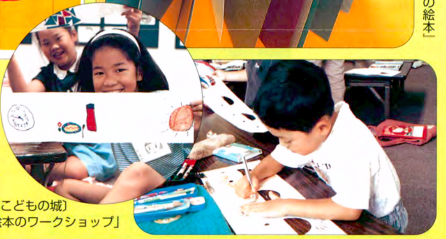
昨年の夏休みに〔こどもの城〕で開催された「絵本のワークショップ」