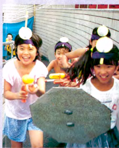
ワンダー・スプラッシュ (屋上/8月13～17日)