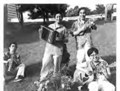
アンデルセンの童話を再構成して、暗いイメージを吹き飛ばそうと思います。

8月22～26日 青山円形劇場 子どもたちに、自分の童話がどれだけ親しまれているか知りたくなったアンデルセンが、突然、現代の青山円形劇場にやって来て、大騒動を巻き起こします—夏休みの思い出に贈る、第12回こどもの城・キリン・ファミリー劇場「サ