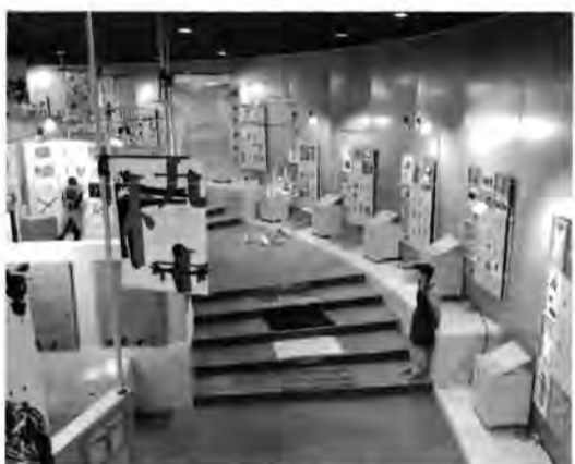
ギャラリーはカラフルな展示でいっぱい

会場には、障害や障害者の美術教育に関心を呼び起こすためのパネル展示、養護学校に通う子どもたちが制作した紙の人物像、布の人形、陶芸の作品などが展示されました。