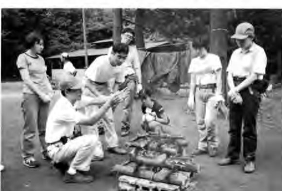
「ファイヤーキーパーの心得」を実習するボランティア

キャンプ場(千葉県船橋市)で行われました。「野外生活基本術～快適な野外生活を送ろう」「焚き出し徹底実習～素早く、おいしく、たくさん作るコツ」「集いの火を創る～ファイヤーキーパーの心得」ナイト