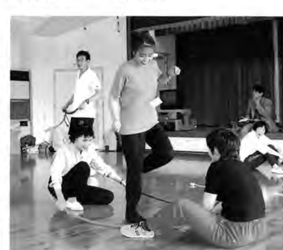
なわを使ってバンブーダンス(波方児童館で)

「動くこどもの城」は、9月18日「手作り楽器のワークショップ」(京都市)、10月2日「お母さんと赤ちゃんの体操」(大分県)、10月15日「同」(石川県)、10月26日「おんがくがスキ」(茨城県)を予定しています。