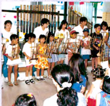
おいでよ パラダイス・アジア (音楽ロビー/8月5～24日)