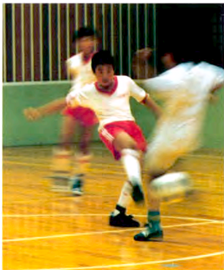
9月15日の「敬老の日」には、おじいちゃん、おばあちゃんに昔遊びを教えてもらうなどの交流プログラム(写真右)、「体育の日」には〔こどもの城〕独自のウォールサッカー大会を開催(写真上)。

スポーツの秋、読書の秋、食欲の秋、芸術の秋——気候もおだやかで、なにをするにも適した季節。東京オリンピックも、気候条件などを考えて昭和39年(64)の10月10日から開催されました。今の「体育の日」です。運動会(体育祭)や文化祭などを行う学校も多いようです。〔こどもの城〕も昭和60年(85)11月1日に開館し、この前後を特別期間としていろいろなプログラムを行っています。秋は収穫の季節。農業が盛んなころには、収穫(自然の恵み)に感謝する秋祭りなども各地で行われてきました。