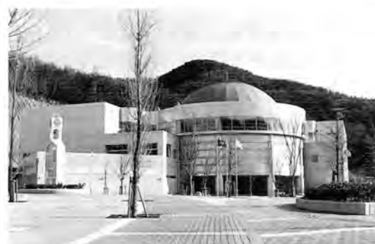
ぐんまこどもの国の全景

「ぐんまこどもの国児童会館」のある、群馬県太田市は関東内陸工業地域の代表的な工業都市。活気あふれる町です。施設は市の中心地から車で10分ほどの自然環境にめぐまれた金山総合公園にあり、3階建ての建物の1階には科学遊びの展示室と鮮やかな映像が楽しめる「ハイビジョンシアター」がある「サイエンスワンダーランド」。2・3階にまたがる「スペースシアター」は直