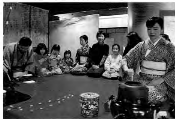
今年の「保育フェア」では、お父さん、お母さんが大活躍

保育クラブ・幼児グループの保護者と保育者が一緒になって企画をねらいにしています。7・8人の保護者が集まり、6月