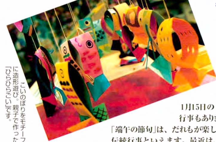
このほりをモチーフに造形遊び。親子で作った「はるのこま」。