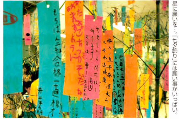
星に願いを...七夕飾りは願い事がいっぱい。