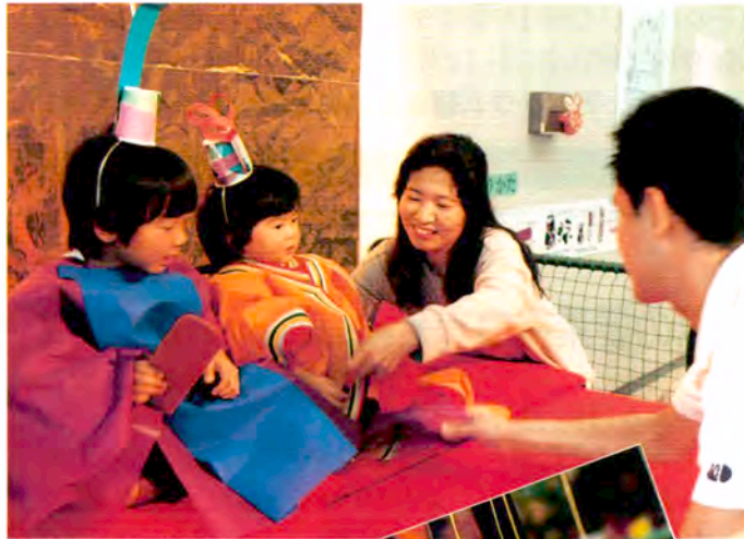
内裏(だいり)様に変身!