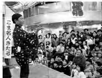
こま名人きたる! (音楽スタジオ)