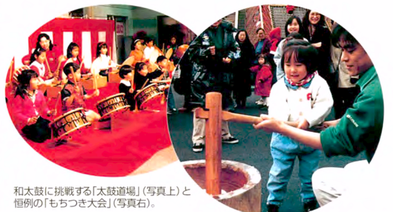
和太鼓に挑戦する「太鼓道場」(写真上)と恒例の「もちつき大会」(写真右)。

春を迎える「節分」。無病息災を願う古くから伝わる季節行事。参加劇の形で「節分」のいわれを伝えます。