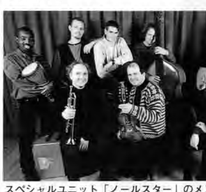
スペシャルユニット「ノールスター」のメンバー

ノールスターは、現代のノルウェーを代表するジャズ・伝統音楽のトップミュージシャン7人のスペシャルユニット。新しいノルウェーサウンドを披露すると同時に[こどもの城]の音楽講座・クラブの子どもたちと共同作業で新しい音楽を作るワークショップを行いその成果