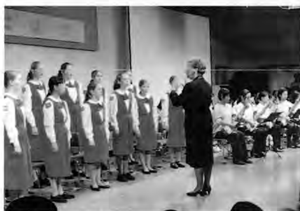
「日本カナダ交流コンサート～こんにはカナダ」

コンサートの前日は、[こどもの城]で、日本の遊びとカナダの遊びをお互いに紹介し合う集いも行われ、記念写真を撮影したり、記念品を交換したりしました。夜は、[こどもの城]の講座・クラブ受講生の家に2人1組でホームステイ。日本の「家庭」を体験、交流を深めました。