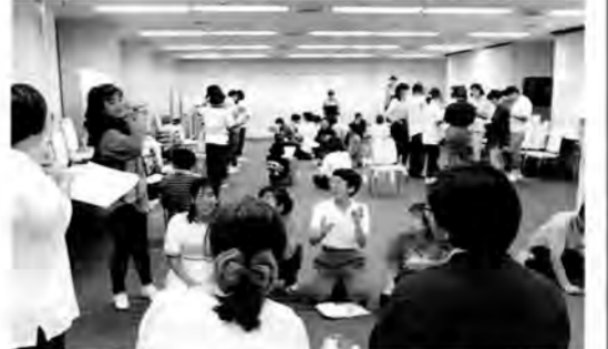
実技を中心とした講習会なので、参加者同士の交流も自然に深まります。

【概要】[こどもの城]の音楽・体育部門の実践活動を紹介します。“音”をテーマとしたさまざまなプログラムを体験し、紹介し、お問い合わせは、[こどもの城]企画研修部☎03-3797-5665へ。