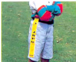
左右にタグ(リボン)がついた「タグ・ベルト」

ルールは、プレイする子どもたちの年齢や運動能力などを考えて、柔軟に対応します。例えば、トライの方法もグラウンディング(地面にボールをつける)しなくても、ボールを持ってゴールラインを越えるだけでもトライと認めたり、1チームの人数も5～7人ぐらいと幅があります。