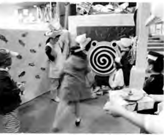
たくさんの「家族」でにぎわった「ファミリーフェア'98」

の最終日にあわせて、「家族をつなごう」をテーマに開催されました。昨年6月から準備を重ねてきたもので、お父さん、お母さんの“特技”を生かしたプログラム(切り紙のワークショップやミニ茶会など)や、親子で楽しめる「体験型すごろく」が行われました。