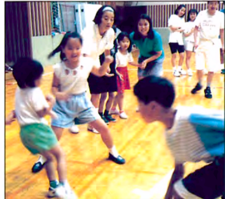
体育室では、いままでいろいろな“鬼ごっこ”を取り上げてきました。

春休み特別期間の体育室では、幼児から楽しめる“鬼ごっこタイム”で体をほぐしたあと、小学生以上を対象に「タグ・ラグビー」(3月26日～29日)、「フットサル」(3月30日～4月2日)と「バスケット」(4月3日～5日)が行われます。いずれも“ボール(を持った人)を追いかけるスポーツ”で、どこか“鬼ごっこ”と共通するものがあります。