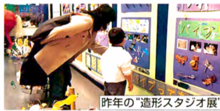
昨年の“造形スタジオ展”

平成9年11月から今年の10月までの1年間にわたる造形スタジオの活動を紹介します。[光]をテーマにしたプログラムを中心に展示します。