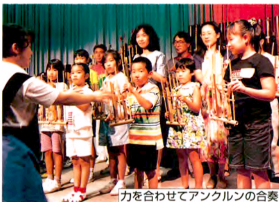
力を合わせてアングルンの合奏

ハンドベルのように、1つの楽器で1つの音を鳴らす、アングルン。竹でできたインドネシアの民族楽器です。初めて手にする人も多いと思いますが、だれもが簡単に音を出すことができます。しかし、1つの曲を演奏するためには、1つ1つの音を担当する“パパ ママ わたし”が力を合わせて演奏しなければなりません。