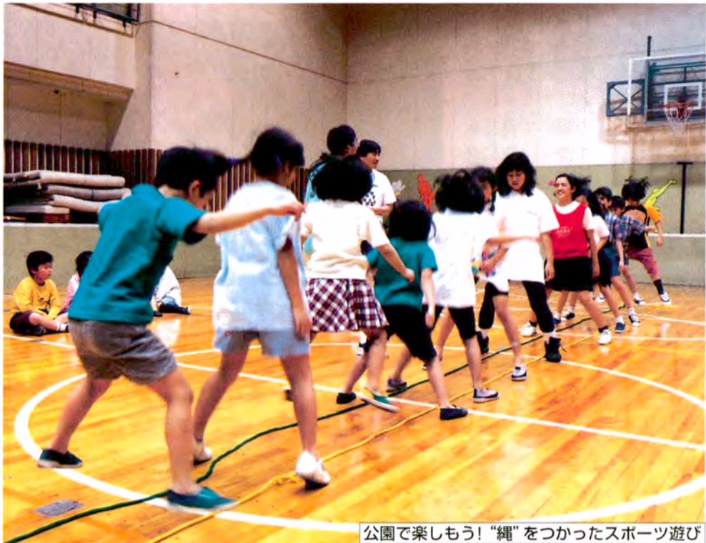
公園で楽しもう!“縄”をつかったスポーツ遊び

コスモスは、ギリシア語で“飾り”とか“美しい”という意味です。 秋風にはかなくゆるゆるは、まるで「おいで、おいで」とまねきしているようで、誘われた私はアゲアゲ。私がとまると、ゆらりと大きくおじぎをしたの。私、そんなに重くないわよ。ほら、だれかが立ち止まってこっちを見ているじゃない。「あら、秋ね」ですって……。 (こどもの国=横浜)