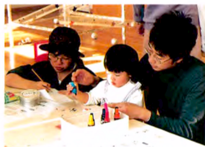
親子でいっしょに“親子工房”

秋の木の葉や押し花を使って、世界でただ1つの“オリジナルカラーージュ”を親子で作ります。