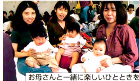
お母さんと一緒に楽しいひとときを

2歳までの赤ちゃん大集合! 小児科医の楽しいトークや親子体操、音楽遊びなどがあります。