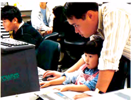
パソコンをつかえば作曲家!?