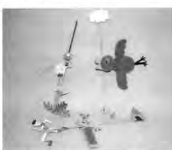
「造形・竹づくし」。タケ・テケ・テケ(親子)とパンフーン(新小2~・写真左上)

竹をつかって跳んだり、跳ねたり、音が出たり、楽しく遊べる新しい竹の玩具作り(3月20日~4月5日・造形スタジオ/3月23日は休館)。