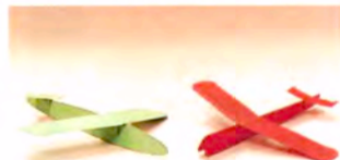
ペーパークラフト(紙飛行機)

〔こどもの城〕のパソコンルームでは、コンピュータの便利で楽しい所を利用した、いろいろな「遊びのプログラム」をこれからも作っていきたくて考えています。