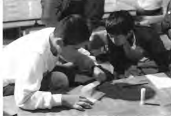
【こどもの城】では、紙と筆記具だけでできる「くるくるアームをつくる」(毎週土曜日)のほか「ライトパノラマ」「マトロップ」「ピンホールカメラ」など、〈映像〉をテーマにしたワークショップ「不思議な映像実験室」を定期的に開催しています。