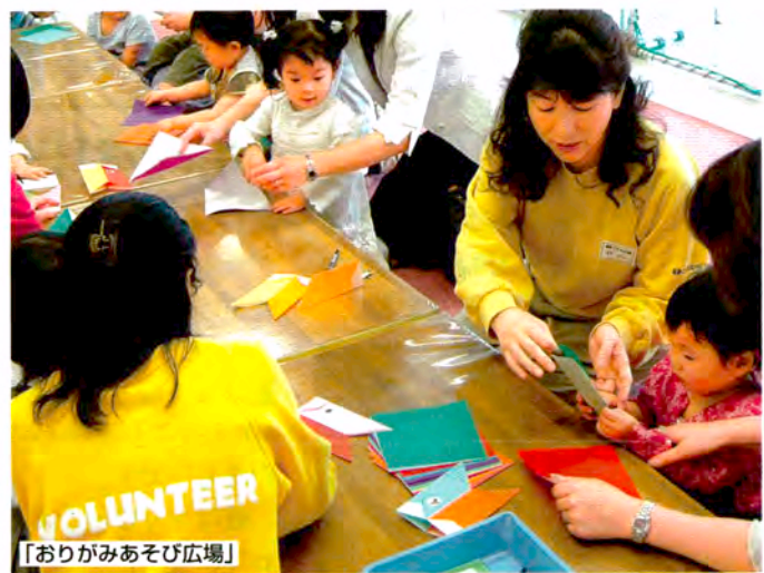
「おりがみあそび広場」

広場」(日曜日、月1・2回/15時~15時30分)—が行われています。これらのプログラムは、「人」と「人」とが直接ふれあって、なにかを伝えたり、感じたりすることを大切にしています。「みんなのこにこ広場」では、女性ボランティアのグループが、目の前で人形劇や影絵、紙芝居を演じてくれます。「おりがみあそび広場」では、ボランティアが一人ひとりに話しかけながら折り方を教えてくれます。人とふれあい、遊びを楽しむことで、子どもたちはさまざまなことを体験・学びます。