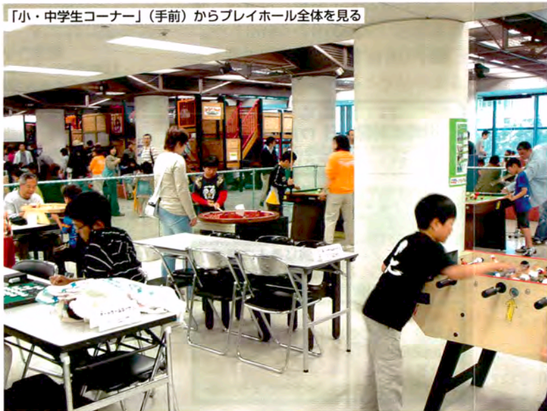
「小・中学生コーナー」(手前)からプレイホール全体を見る

乳幼児から小・中学生まで幅広い年齢の子どもたちがいるので、それぞれが安全に楽しく遊べるように、遊びの種類や年齢によって“すみわけ”の工夫もしています。