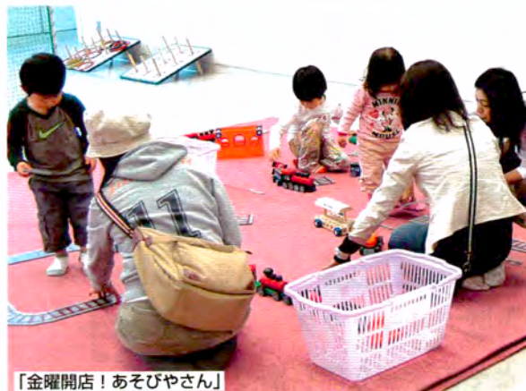
「金曜開店! あそびやさん」

プレイホールのなかに、曜日によって異なるプログラムを行っている「集いの広場」があります。〔こどもの城〕のスタッフやボランティア、そしてプロの人形劇団の人たちと、遊びにきた子どもたちがふれあう場になっています。今月は、曜日ごとに異なる「ひがわりプログラム」を中心にプレイホールの活動を紹介します。