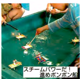
スチームパワーだ! 進めボンボン船

※日曜日(不定期)にボランティアによる「マックロー人形劇場」【パネルであそぼう】も行われています。6月7、28日、7月12日(11時30分、13時)に開催。