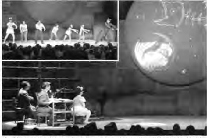
「月猫えほん音楽会2009」。参加コーナーで演技する「子猫」「親猫」(左上)

ら、3つの「お題」をもらって、お話しも即興で作るコーナーや会場の親猫・子猫にステージにあげてもらいパントマイムでおはなしを演じるコーナーもありました。