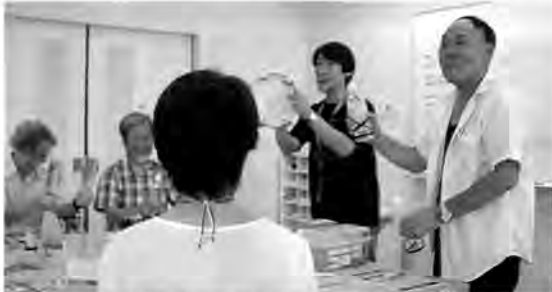
「動くこどもの城」手作り楽器のワークショップ(清瀬市)

国の助成を受けて行っている「動くこどもの城」は、「こどもの城」と全国の児童館をつなぐプログラム。「こどもの城」の「遊びのプログラム」を各地の子どもたちに体験してもらおうと同時に、児童厚生員などにプログラム作り・運営の経験を伝える活動です。北は北海道から南は沖縄県まで、スポーツ、音楽、造形、映像などさまざまな分野にわたって、親子や仲間と楽しむさまざまな「遊びのプログラム」をもって、全国を回っています。