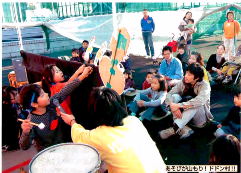
あそびが山もり! ドドン村!!

「こどもの城ファミリー月間」には、「家族」で楽しめる〈あそび〉のプログラムがいっぱい。お父さん・お母さんも、子どもといっしょになって遊んでほしいと思います。