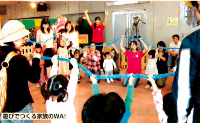
遊びでつくる家族のWA!