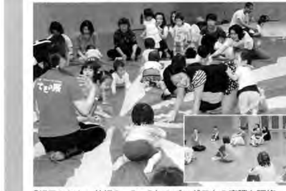
「親子ふれあい体操1・2・3」のプログラムの実際と研修

午前中は地域の親子が参加する「子育て教室」の1プログラムとして、「親子ふれあい体操」を[こどもの城]スタッフが実施。他の地区のメンバーも、教室担当のスタッフと一緒にプログラムに参加しながら、指導の実際を体験。