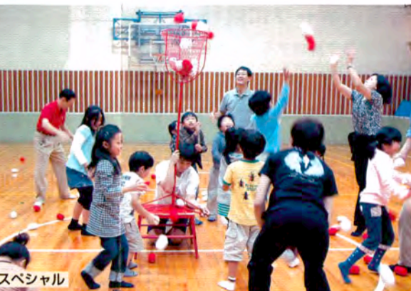
大運動会スペシャル

おおきなリスは、どんぐりがたくさんあって、グリグリ、グリグリ、リスはどんぐりを、いっしょうけんめいたべました。たべきれないぶんは、しめんにうめて、やっはりめがでて、おおきなリスになって、どんぐりが、たくさんありました。グリグリ、グリグリ、リスはどんぐりを、たべつづけました。すると、いつのまにか、おおきな、どんぐりのもりが、できあがっていました。リスは、「もったいぶれないや」とおもいました。