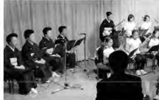
こどもの城開館25周年記念 合唱団コンサート 11月7日 青山劇場

【こどもの城】三味線講座25周年記念「三味線の調べ」が、9月26日にBスタジオで開かれました。開館と同時にスタートした「三味線講