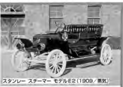
スタンレー スターマー モデルE2 (1909/蒸気)

こどもの城児童合唱団は、【こどもの城】の開館に先けて作られました。子どもの「あそび」から生まれる創造性、自己表現活動を大切に