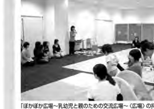
「ほかほか広場~乳幼児と親のための交流広場~(広場)の持ち方と相談」(徳島県子育て総合支援センター「みらい」)