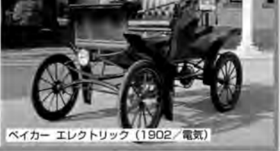
ペイカー エレクトリック (1902/電気)