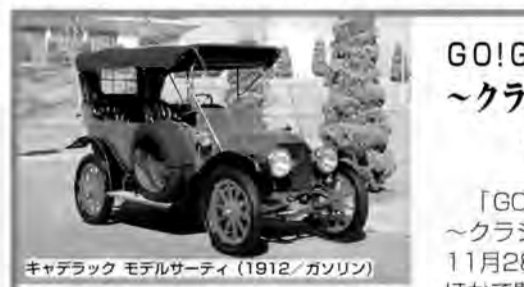
キャデラック モデルセーティ (1912/ガソリン)

こどもの城児童合唱団は、【こどもの城】の開館に先けて作られました。子どもの「あそび」から生まれる創造性、自己表現活動を大切に