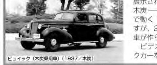
ビュイック (木炭炭素車) (1937/木炭)