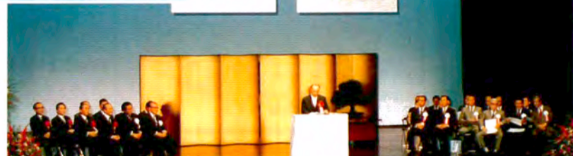
1985年(昭和60年)10月22日、青山劇場で「こどもの城開館式」を挙げる。11月1日午後0時30分から一般公開(無料)。2日から平常どおりに運営。

〔こどもの城〕は、11月1日に25回目の誕生日を迎えます。1979年の「国際児童年」を記念して、厚生省(当時)が計画・建設。これからの日本、世界を支えていく子どもたちに、たくましく、すこやかに育ってほしいと願って、芸術・科学・体育・保健・保育など、子どもの文化と福祉・健康のためのさまざまな機能をそなえた総合児童センターとして、1985年(昭和60年)11月1日に開館しました。〈あそび〉をキーワードに、子どもたちの「育ち」を支える活動を続けています。〔こどもの城〕の活動のなかで大切にしてきたもの、これからも大切にしていきたいものを聞きました。