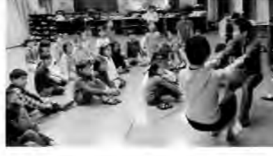
パントマイムワークショップの様子

〒150-0001 東京都渋谷区神宮前5-53-1 電話:03-3797-5678 e-mail:datto@aoyama.org FAX:03-3797-5770 氏名(ふりがな)・学年・住所(郵便番号)・電話・FAX・e-mailを記入して、e-mail、FAXまたは郵送でお申し込みください。受け付け後、ご案内をお送りします。定員になりしだい締め切り。