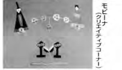
モビーナ(クリエイティブコーナー)