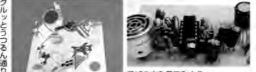
機械の中を見てみよう

※小学生ラボ=平常期間の土・日曜日13時~16時(月1回)にプレイホールで、いろいろな不思議なチャレンジ。小1以上が対象。