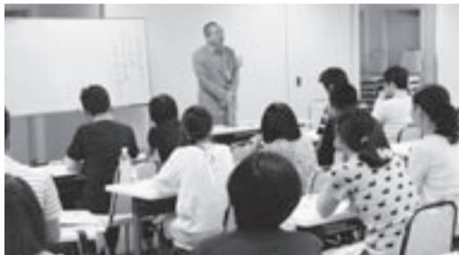
「オバケの気持ちを考える～日本の物の怪～」(国立歴史民俗博物館の常光徹教授)

講習会のテーマは、「遊びの専門技術～オバケやしきを 10 倍楽しくする方法～」。夏に向けて児童館のお化け屋敷作りで役立つノウハウについて、お化け屋敷の体験! ? も交えて講習が行われまし