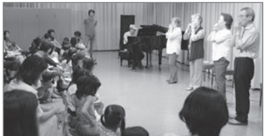
草笛大好き「わいわい草笛団」の 4 人組が、6 月 5 日の「わいわいスタジオ～草笛コンサート」で演奏を披露。子どもたちも草笛にチャレンジ!

太鼓の総合イベント「TAIKO JAPAN 2011」では、初心者から経験者までを対象とした「和太鼓カレッジ」(8 月 26～28 日)／青山円形劇場、コンサート「青山太鼓見聞録 伝統の種子、その展開」(26 日)／青山劇場)と「太鼓見聞