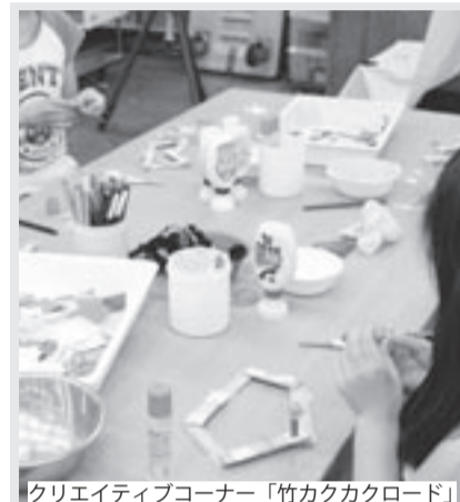
クリエイティブコーナー「竹カクカロード」

◆ほかほか広場 (火 禮) / 月 1～2 回 / (11 時～14 時) 3 か月～2 歳 11 か月の乳幼児と保護者が安心して過ごせる広場です。子ども同士のおふれあい、お母さんの情報交換、親子遊びの紹介など。 7 月 5 日/4 階 音楽ロビー ◆赤ちゃんサロン (火 禮) / 月 1～2 回 / (11 時～14 時) 3 か月～1 歳 6 か月の乳幼児と保護者。これから母親になる人のための子育て広場。専門スタッフ(小児科医師、保健師、管理栄養士、臨床心理士など)も話の輪に加わって、情報を交換。 7 月 5 日/4 階 音楽ロビー