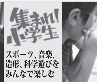
小学生ラボ「表面張力に挑戦! ? アメンボの科学」