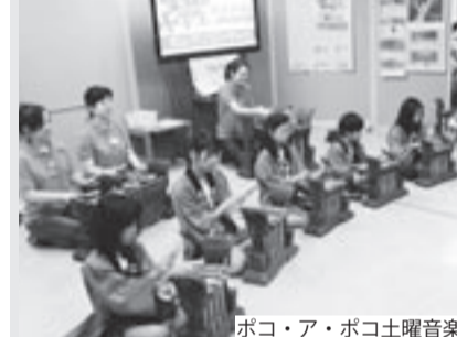
ポコ・ア・ポコ土曜音楽倶楽部「ガムラン」